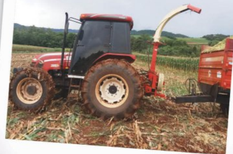
Gilmar Nalim , de Águas de Chapecó (SC)

Quer aparecer nesta seção? Envie sua foto pelas nossas redes sociais no Facebook (Agritech Lavrale) e Instagram (@agritech.lavrale), com o seu nome completo e cidade.