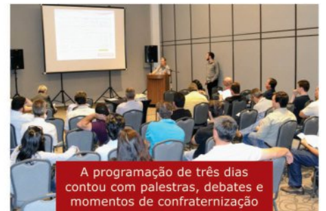
A programação de três dias contou com palestras, debates e momentos de confraternização