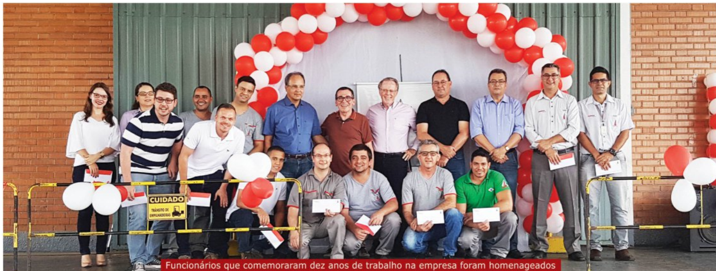
Funcionários que comemoraram dez anos de trabalho na empresa foram homenageados