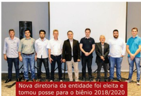
Nova diretoria da entidade foi eleita e tomou posse para o biênio 2018/2020

Na ocasião, também foram homenageados as concessionárias Top 15 de 2018, que mais venderam este ano.